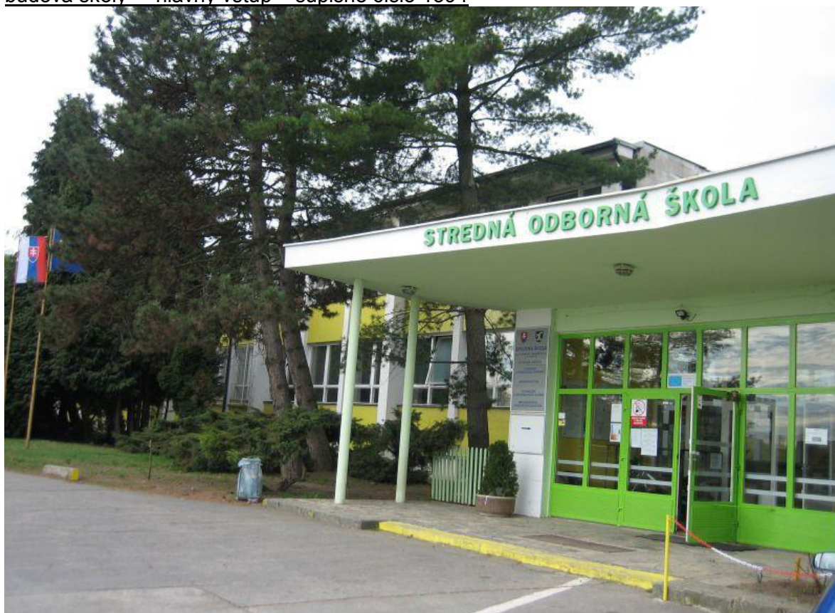
budova školy – hlavný vstup – súpisné číslo 1394