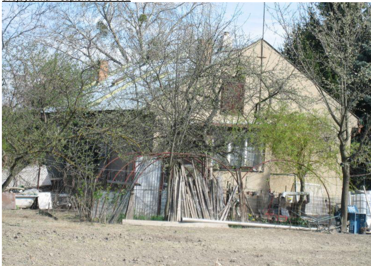
dvojbytovka – súpisné číslo 952