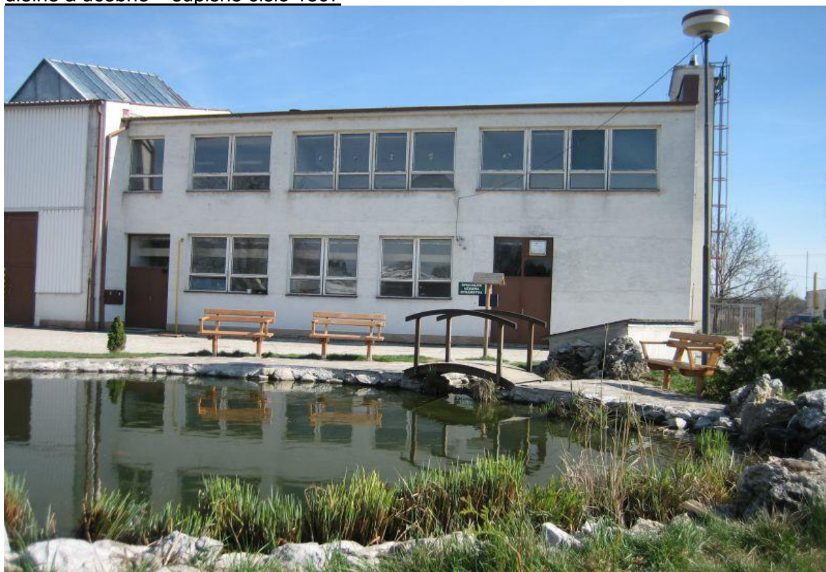
kotolňa – súpisné číslo 1807