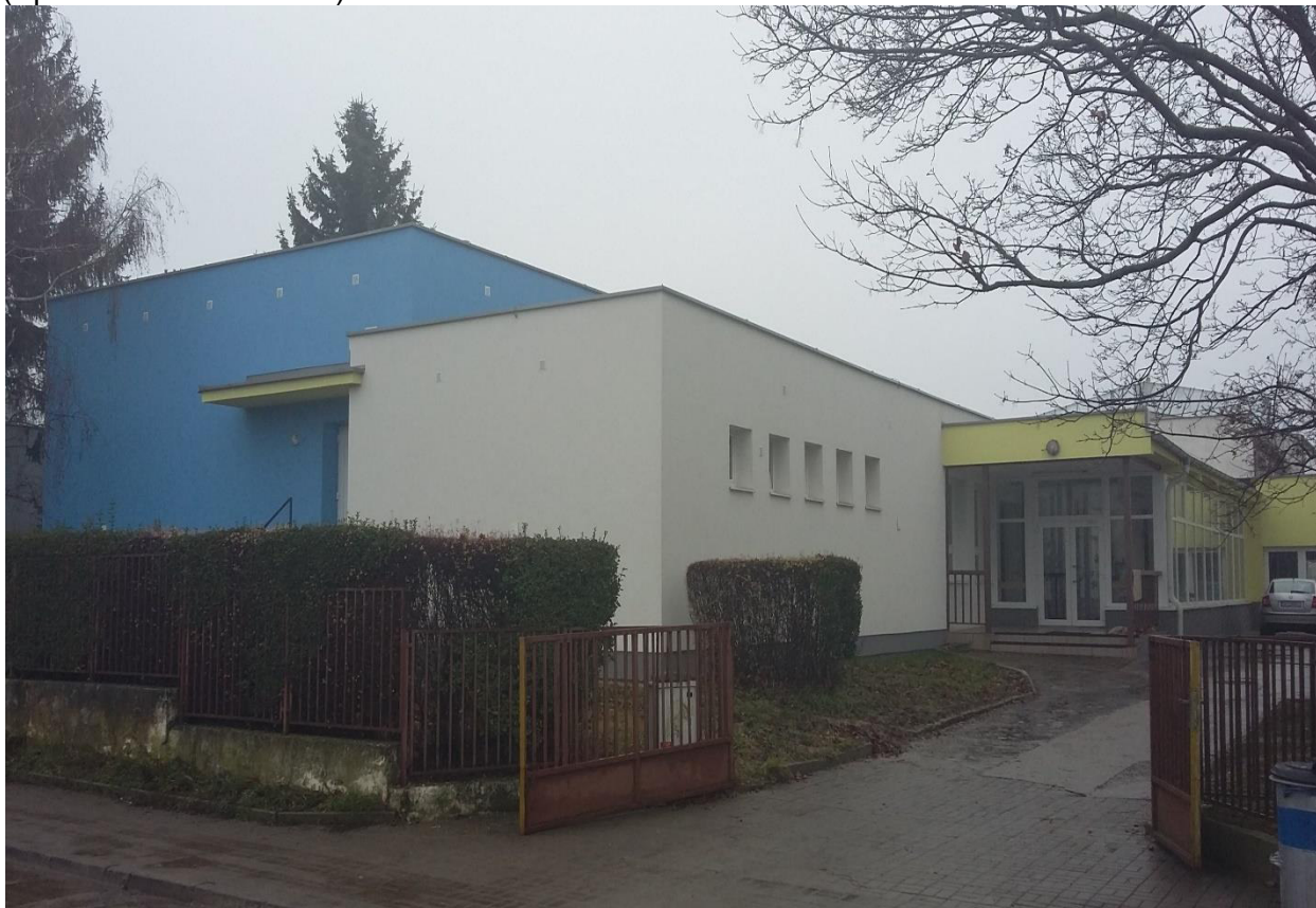
budova – školský bufet – súpisné číslo 1803