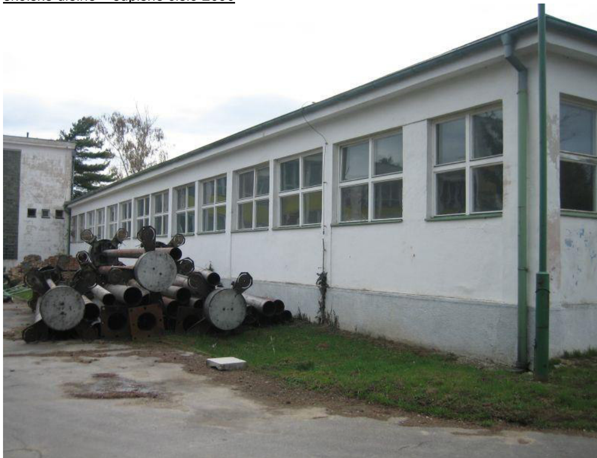
odborný pavilón – súpisné číslo 2691