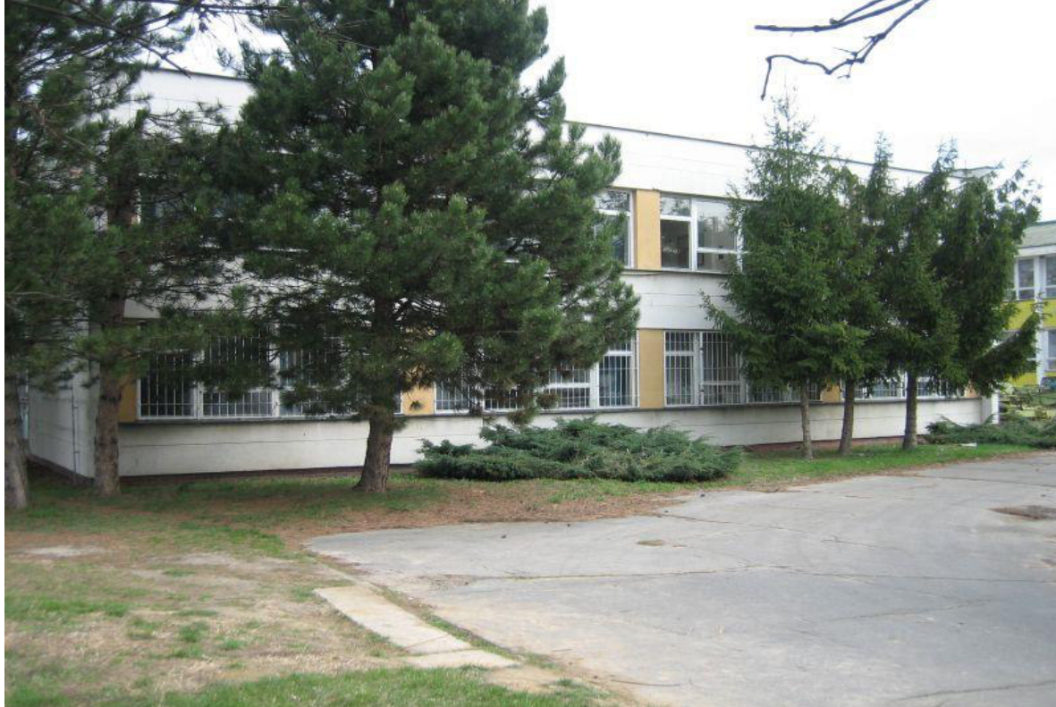
budova školskej jedálne – súpisné číslo 2692