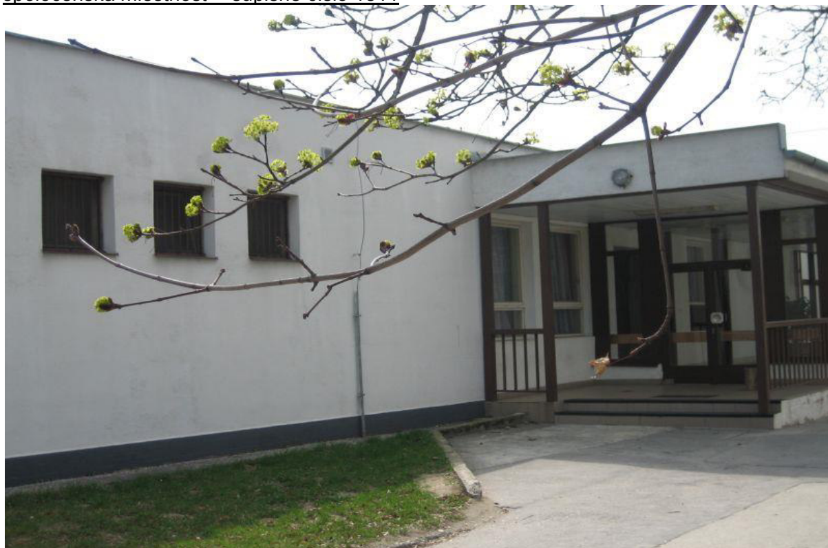
areál Ivanka pri Dunaji – časť Zálesie